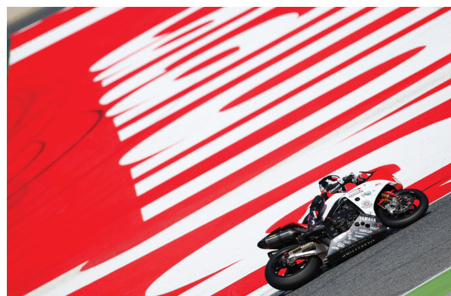
Arturo, curva de la Caixa.