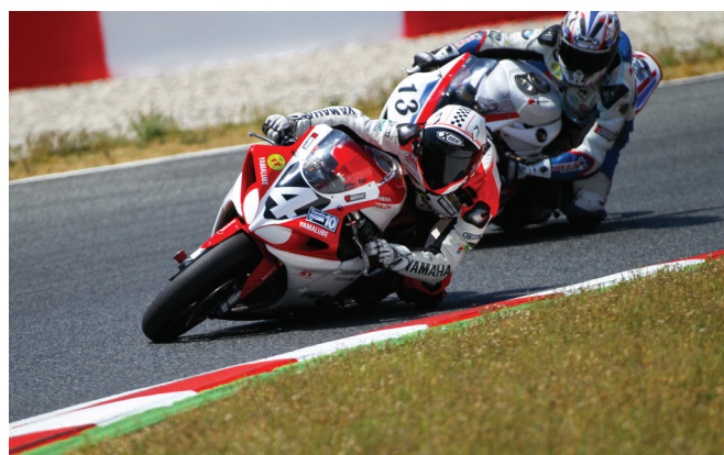
Vallcaneras, competitivo de principio a fin.