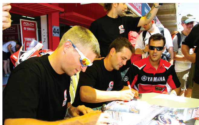
Firmas y autógrafos durante casi una hora y al sol.